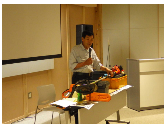
高岡索道工機 高岡講師