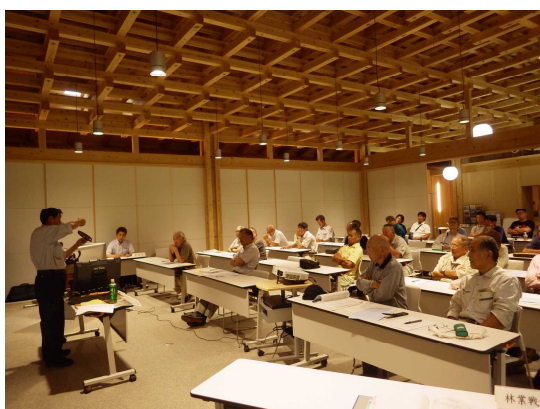
道具の手入れについての講義