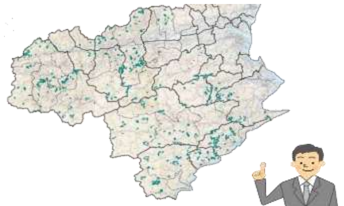
徳島県内の全域に広く分布する分収林